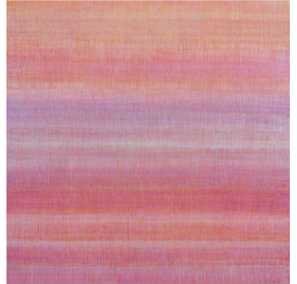
La suma Nº10 Acrílico / lienzo, 80x80cm, 2023