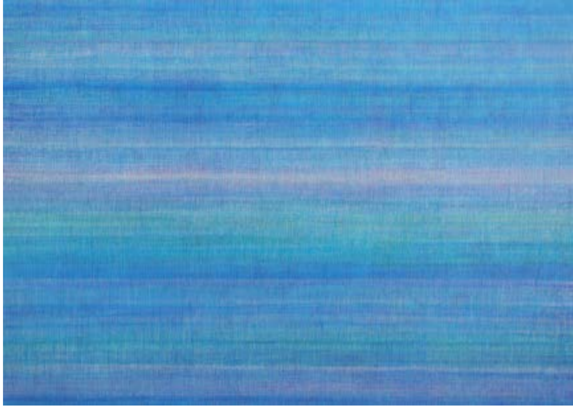
La suma XXVI Acrílico / lienzo, 114x162cm, 2020