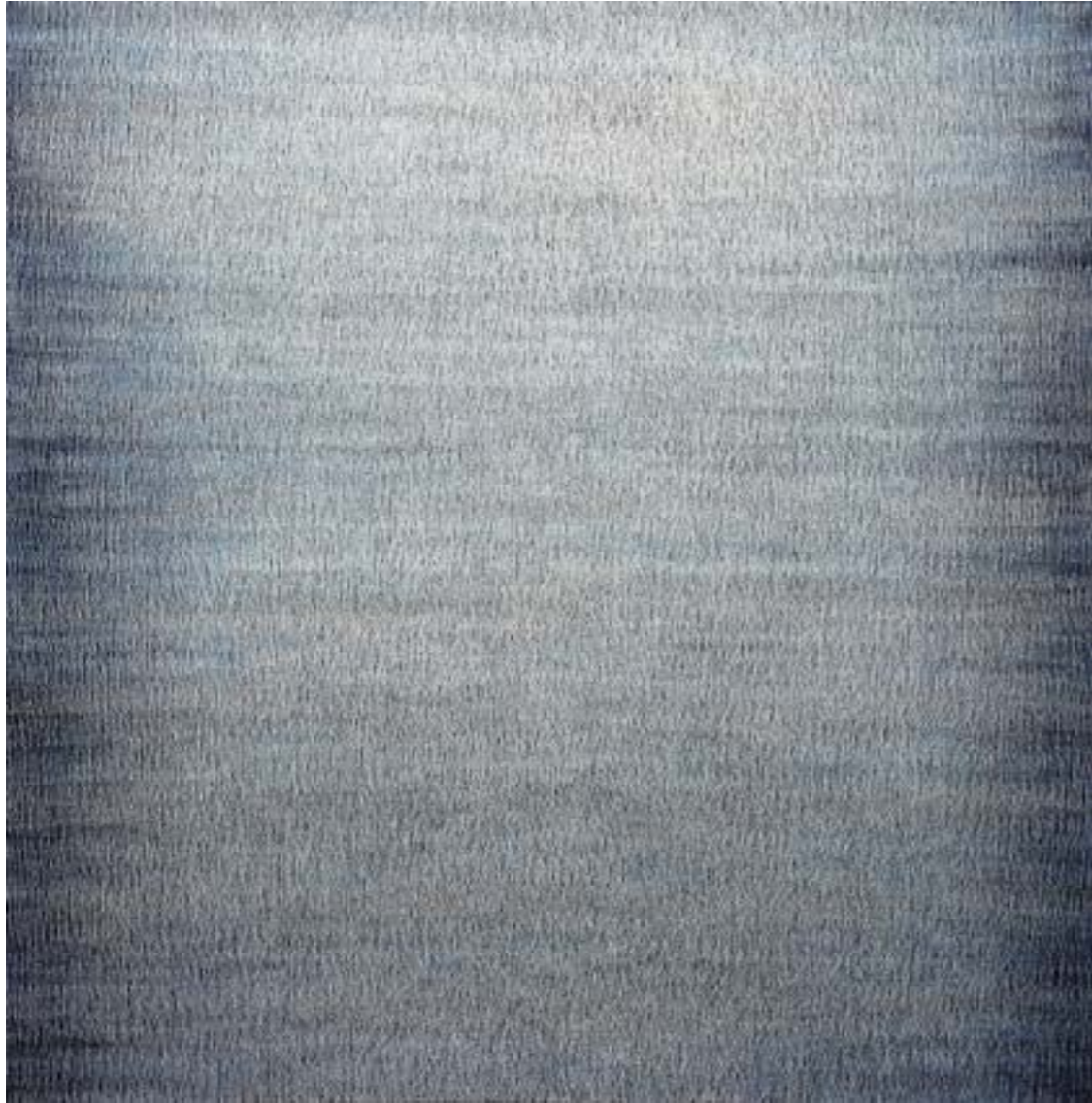
La suma III Acrílico / lienzo, 146x146cm, 2017