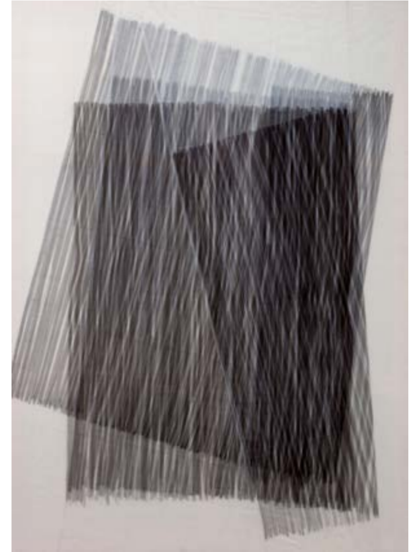
W-Nº8 Tinta, tela nylon / lienzo, 180x130 cm, 2012