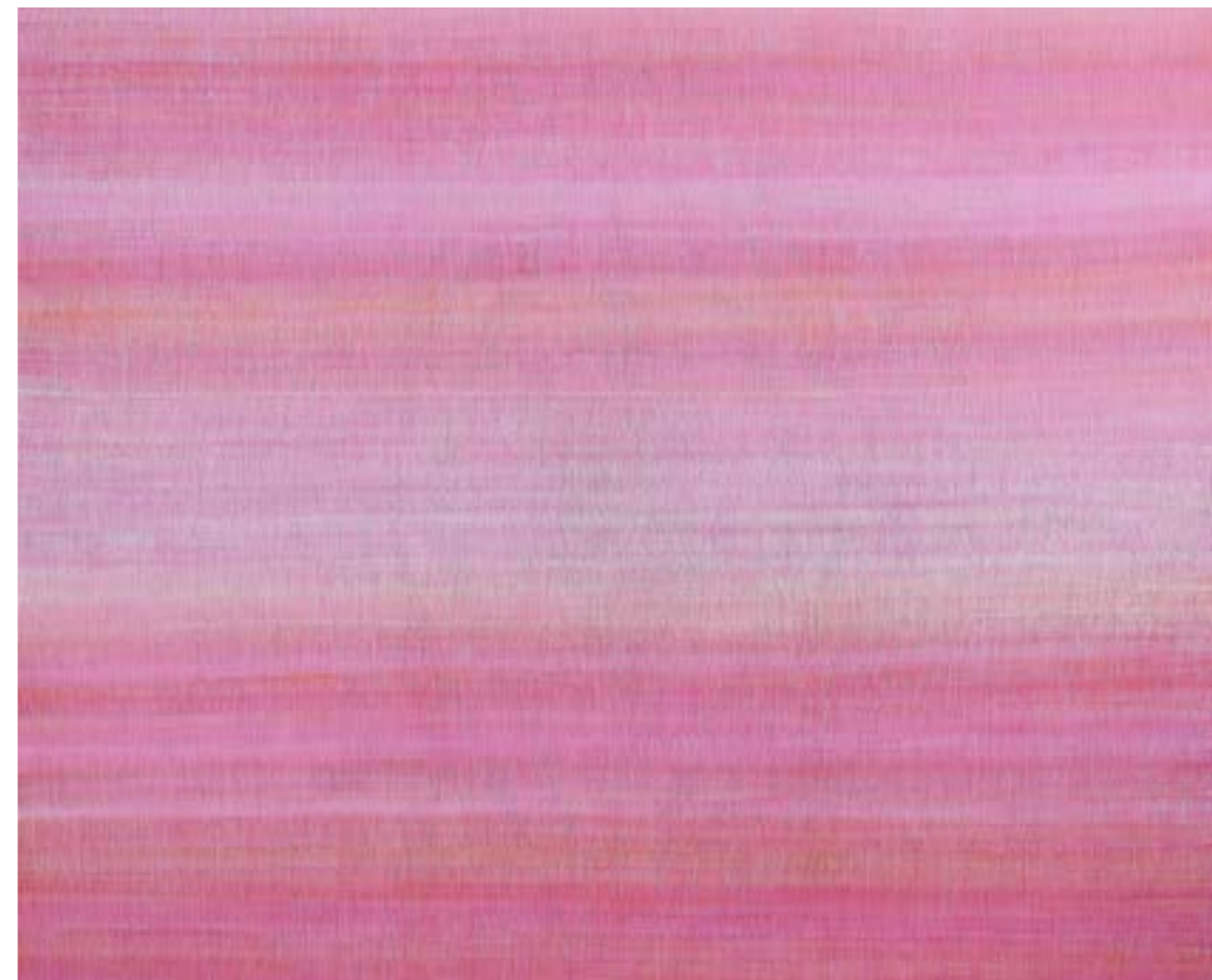
La suma XXII Acrílico / lienzo, 146x180cm, 2021