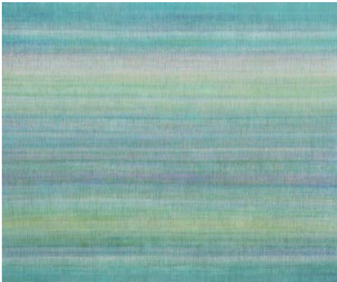
La suma XXXII Acrílico / lienzo, 114x146cm, 2022