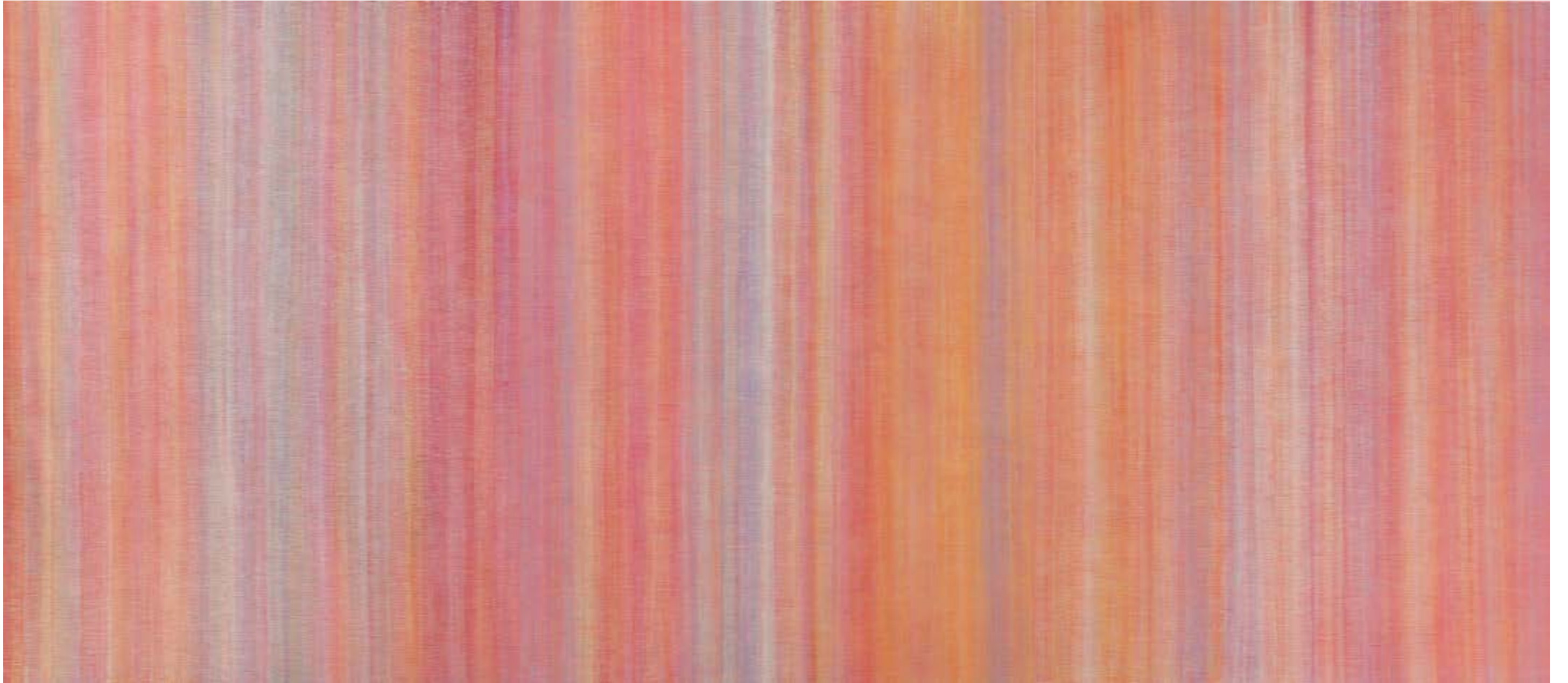
Frente a los signos III Acrílico / lienzo, 185x438cm, 2023