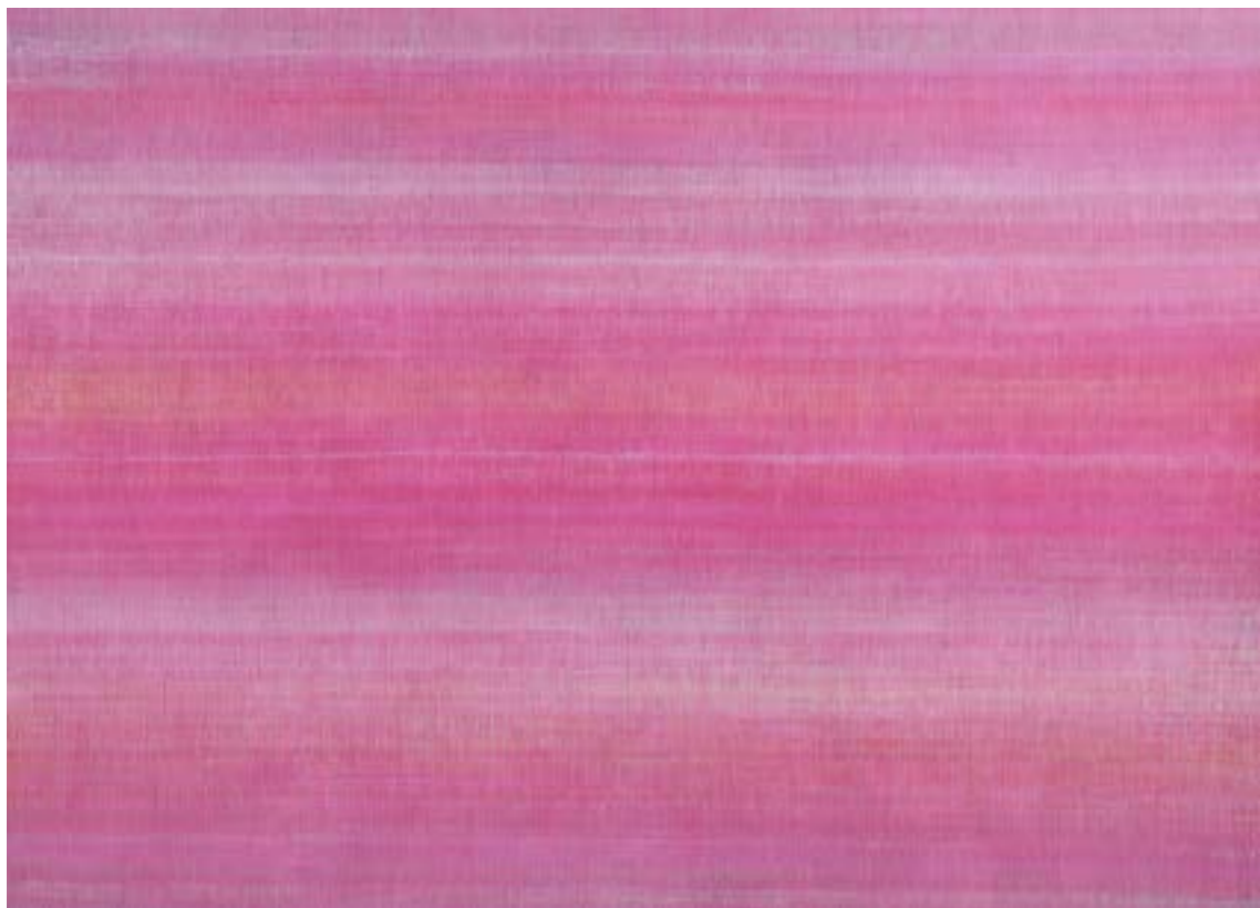
La suma XXIV Acrílico / lienzo, 130x180cm, 2021