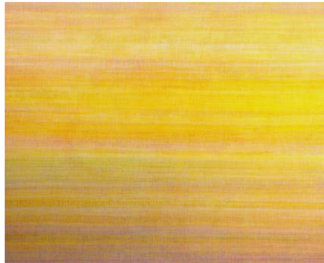
La suma XXI Acrílico / lienzo, 146x180cm, 2021